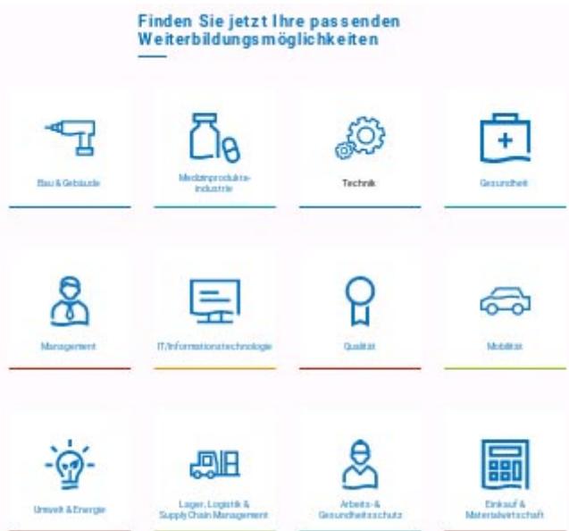
Übersichtliche Auswahlmöglichkeiten für Seminare